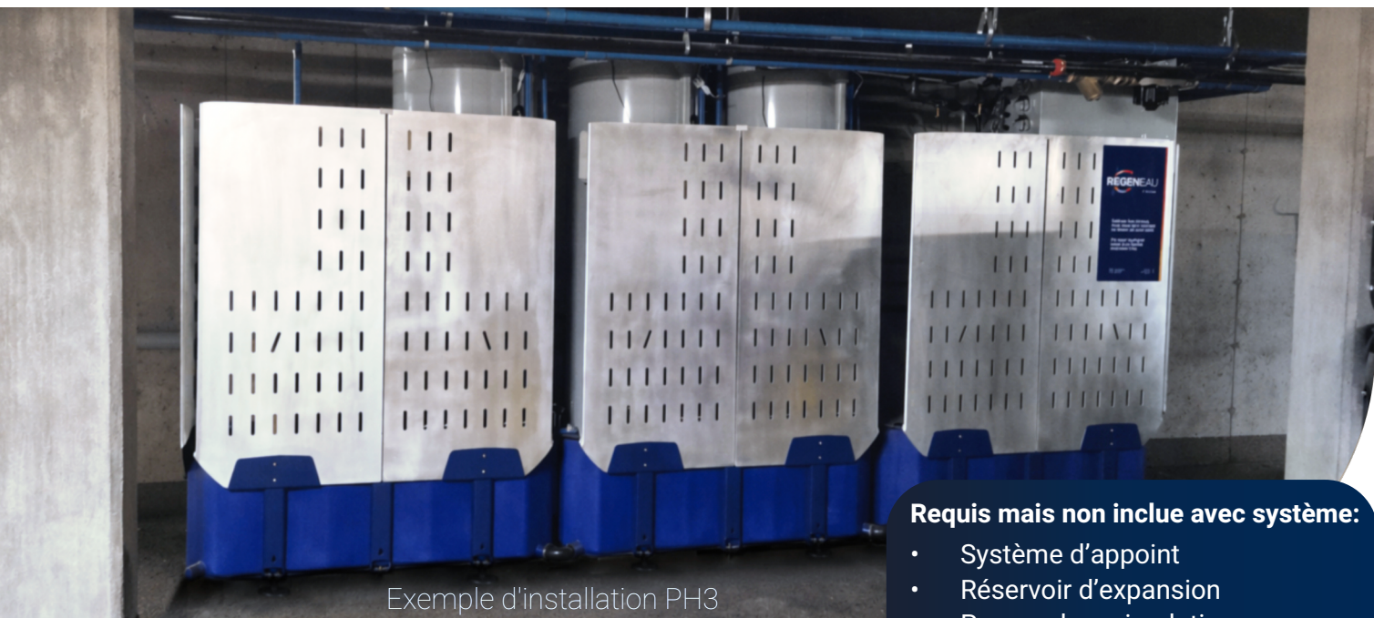
Exemple d'installation PH3